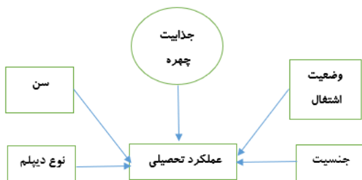
شکل ۱. مدل مفهومی پژوهش (محقق ساخته)

کسب آرای انتخاباتی، مذاکره و امثالهم تأثیر گذار است) کو و همکاران، ۲۰۲۱) هم چنین، مطالعات در حوزه روانشناسی نیز تایید نموده اند افراد با چهره گرد، از هوش کمتری برخوردار بوده و عملکرد تحصیلی مناسبی ندارند(کلایزر و همکاران، ۲۰۱۴)، لذا پژوهش درباره نقش جذابیت چهره در عملکرد تحصیلی می تواند ارزش افزوده علمی به شرح زیر داشته باشد: اول آن که نتایج این پژوهش می تواند موجب بسط و گسترش مبانی نظری متون مرتبط با عملکرد تحصیلی دانشجویان رشته حسابداری در حوزه آموزش حسابداری شود. دوم آن که نتایج مقاله حاضر می تواند اطلاعات سودمندی درباره نقش چهره افراد در ارزیابی عملکرد و موفقیت تحصیلی در اختیار پژوهشگران، استادان و سیاست گذاران حرفه حسابداری و آموزش عالی در راستای ارزیابی عملکرد تحصیلی قرار دهد. بر اساس مبانی نظری، مدل پژوهش به صورت شکل شماره ۱ ارائه می شود.