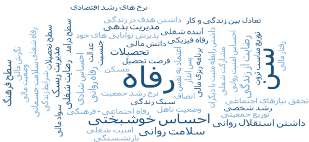
شکل ۱- ابر واژگان با استفاده از نرم‌افزار MAXQDA

همان‌طور که گفته شد برای استخراج مؤلفه‌ها از نرم‌افزار مکس کیودا نسخه ۲۰۲۰ استفاده گردیده است. به این صورت که تمام مقالات منتخب وارد نرم‌افزار شده و کدها به صورت استقرایی مستخرج شدند. دو خروجی از این نرم‌افزار در ادامه ارائه خواهد است. خروجی اول دربردارنده ۵۰ واژه کلیدی بوده که به صورت ابر واژگان در شکل ۱ ترسیم شده است. خروجی دوم نیز مدل نهایی مؤلفه‌ها قبل از غربالگری فازی ترسیم و در شکل ۲ قابل مشاهده می‌باشد. همچنین در جدول ۵ فهرستی از مؤلفه‌های مستخرج شده قبل از غربالگری فازی ارائه شده است.