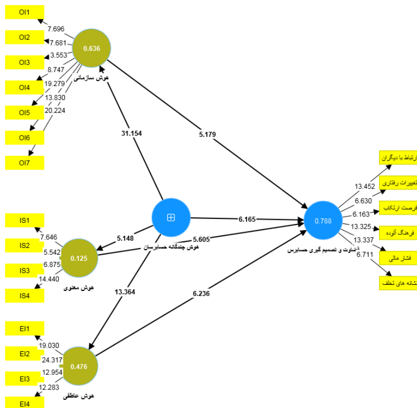
شکل ۲- مدل ساختاری پژوهش همراه با ضرایب آماره T