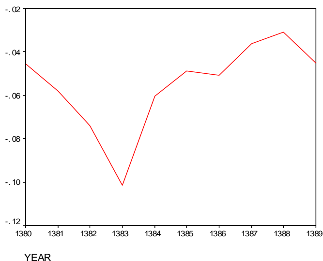
نمایشگر شماره ۲: روند افزایشی محافظه‌کاری

اطلاعات حسابداری شده است. این موضوع می‌تواند به دلایل مختلفی مانند کارا نبودن بازار سرمایه ایران و نوسان در اخبار اقتصادی، رفتار فرصت طلبانه مدیریت سود و تاکید بیشتر حسابرسان مبنی بر رعایت استانداردهای حسابداری مربوط باشد. همچنین محافظه‌کاری غیرشرطی بدون توجه به اخبار خوب و بد و بر اساس استانداردهای حسابداری موجب می‌گردد تا قابلیت اتکا اطلاعات حسابداری افزایش یابد. در نتیجه مربوط بودن اطلاعات افزایش می‌یابد که یافته‌های تحقیق این موضوع را تایید می‌کند. این موضوع ممکن است بواسطه استفاده از استانداردهای حسابداری ایران باشد که برگرفته از استانداردهای بین‌المللی است و تقریباً در اکثر کشورهای