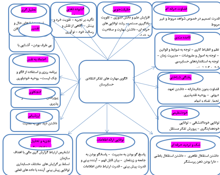
شکل ۳: الگوی مهارت های تفکر انتقادی حسابرسان

نگاره (۱۲) نشان می‌دهد که ضرایب آلفای کرونباخ بیشتر از ۰/۷ بوده و بنابراین پرسشنامه پژوهش و ابعاد آن از پایایی موردقبولی