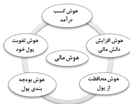
شکل ۱- هوش مالی از نظر کیاساکی (۲۰۱۰)

لی و همکاران ۲۲ (۲۰۰۸) اظهار داشتند هوش مالی در چهار بُعد (ارتباطات، ابزارهای تحلیل، سیستم‌های گزارش دهنده و تصمیم‌گیری اثربخش) بروز پیدا می‌کند. با این وجود به نظر کیاساکی (۲۰۱۰) هوش مالی دارای ۵ طبقه‌بندی خاص خود است که هر فرد با دارا بودن پنج بُعد از هوش مالی مناسبی برخوردار است. شکل (۱) این ابعاد را نشان می‌دهد.