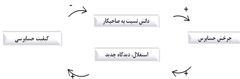
شکل (۲) : تأثیر چرخش حسابرس

پس از ۳ سال می‌تواند کیفیت حسابرسی را بهبود بخشد (باندیپادبای و همکاران ۶۷ ، ۲۰۱۴). آنها ادعا می‌کنند با افزایش طول دوره تصدی حسابرسی، ممکن است فرآیند حسابرسی به فرآیندی تکراری تبدیل شده و حسابرسان به جای ارزیابی و بررسی موارد ادعا شده در صورت‌های مالی به پیش‌بینی نتایج رسیدگی‌های خود با توجه به نتایج رسیدگی‌های سنوات قبل پرداخته و یا از روش‌های رسیدگی عادی و تکراری ناکارآمد استفاده نمایند (گیتزمن و سن ۶۸ ، ۲۰۰۲). بخش ۲۰۳ قانون ساربینز-آکسلی ۶۹ ، مؤسسات حسابرسی را ملزم می‌کند، شرکاء و مدیران خود بعد از هر ۵ سال متوالی کار حسابرسی روی یک صاحبکار واحد تغییر دهند. در مقابل، دیدگاه دیگر به مشکلات حسابرسی در سال‌های اولیه‌ی رابطه‌ی حسابرس-صاحبکار اشاره می‌کند. از نظر این دیدگاه، نداشتن آشنایی دقیق با مواردی مانند نوع عملیات، سیستم حسابداری و ساختار کنترل داخلی شرکت مورد رسیدگی، افزون بر این که موجب افزایش هزینه‌های حسابرسی می‌شود، ممکن است باعث افزایش احتمال عدم کشف اشتباهات با اهمیت و تخلفات اساسی توسط حسابرس شود (سجادی و همکاران، ۱۳۹۱). به اعتقاد آنها تغییر حسابرس مالی باعث خواهد شد، اعتماد سرمایه-گذاران به اتکاء‌پذیری صورت‌های مالی کاهش یافته و از این رو اعتبار حسابرسی کاهش یابد. از طرف دیگر هزینه‌های حسابرسی، چه برای حسابرس و چه برای صاحبکار، افزایش خواهد یافت (سینیت ۷۰ ، ۲۰۰۴). چنین سیاستی ممکن است به دلیل از بین رفتن دانش کسب شده توسط حسابرس قبلی (حسابرس سنوات قبلی) و پیچیدگی محیط گزارشگری مالی،