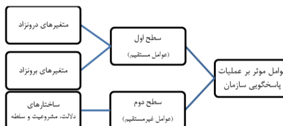
نمایه ۳: عوامل مؤثر بر عملیات پاسخگویی سازمان

آنچه پاسخگویی عملیات واقعی را تعیین می‌کند دو عامل اصلی است که بر عملکرد در دو سطح مختلف تأثیر می‌گذارند (نمایه ۳). در سطح اول، دو عامل مستقیم وجود دارد که ناشی از موارد زیر هستند: (کوکر، ۲۰۱۲).